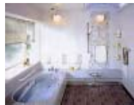
浴槽・洗濯での使用

調理後の流し台に、100 ~ 500ml 程度を、毎日 ~ 週1,2回入れます。