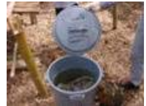
生ゴミ処理での利用

上澄み液 50ml 程度を浴槽に入れます。また、ワイシャツの袖口や襟につけて洗うか、漬け置きします。